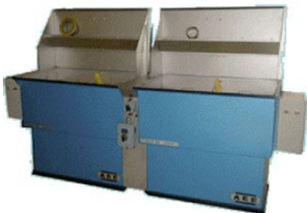
Cubas para inmersión en frío o en caliente

iBiotec® Tec Industries® Service Z.I La Massane - 13210 Saint-Rémy de Provence – France Tél. +33(0)4 90 92 74 70 – Fax. +33 (0)4 90 92 32 32 www.ibiotec.fr